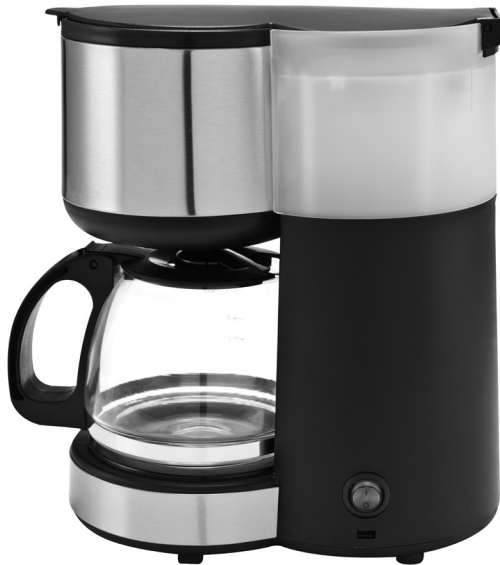
24.3001.00.50 Compact Coffee Maker Deluxe 0.6L